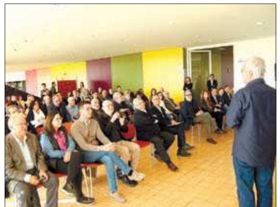
Un moment de l'acte en record de la riuada ahir

ció commemorativa amb imatges dels fets que es pot visitar a la als baixos del Palau de la Paeria fins al 27 de novembre, que, com moltes altres zones properes al riu, van quedar totalment inundats aquells dies. L'exposició compta amb un documental que recull el testimoni de persones de diferents àmbits que ho van viure en primera persona, com ara veïns, personal de salvament i personal municipal. La mostra recull imatges antigues conservades a l'Arxiu Municipal i a l'Arxiu Fotogràfic de l'Institut d'Estudis Ilerdencs. S'han previst uns itineraris per la ciutat els dissabtes per explicar la Riuada.