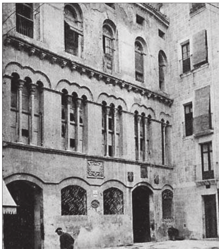
La façana de la Paeria l'any 1929 abans de la seva reconstrucció

El 14 d'abril de 1932 l'alcalde Salustià Estadella va inaugurar les obres de reconstrucció de l'edifici que acull el govern municipal