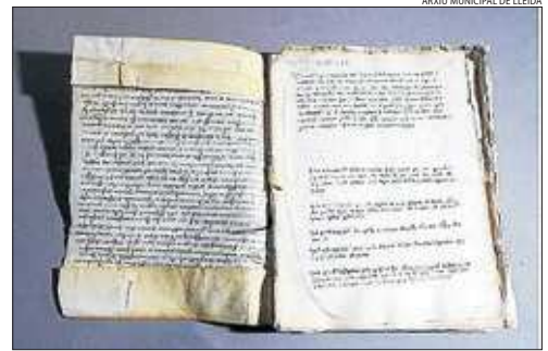
Un dels volums del 'Llibre de crims' ja restaurat.