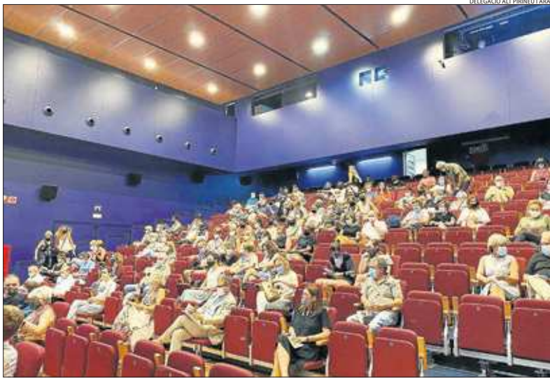
Públic durant l'acte d'inauguració del certamen que va tenir lloc ahir al cine La Lira de Tremp.