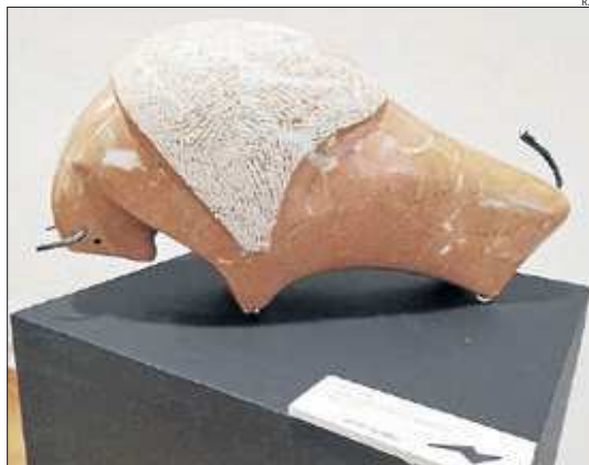
Una de les obres de Ramon Sanfeliu que pot veure's a Llavorsí.