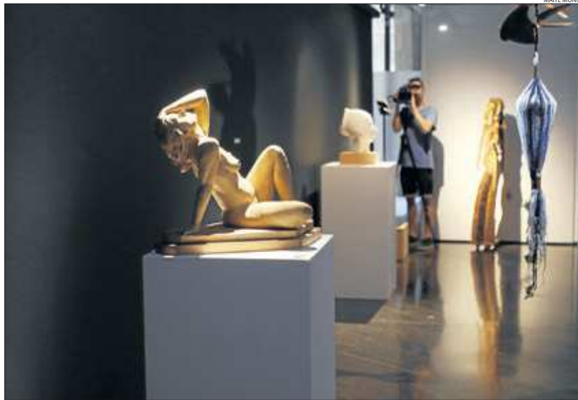
L'Institut d'Estudis Ilerdencs acull des d'ahir les 25 millors escultures del premi Sant Jordi.