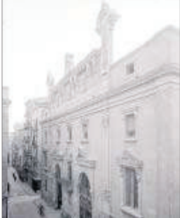
La Diputació pel carrer del Carme als anys 40 i l'estació de Renfe des de la plaça Ramon Berenguer IV als anys 30.