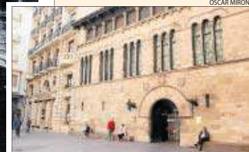
La Paeria, ara i als anys 20.